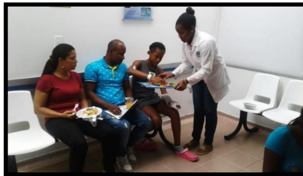
Capacitación a familiares de pacientes