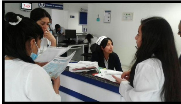
Capacitación al personal del hospital