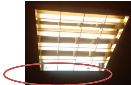
Luminaria LED en proceso